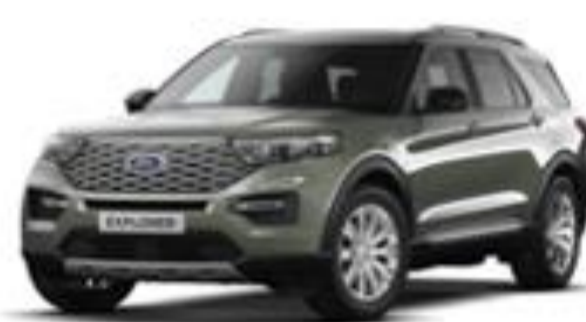
Forged Green * Kun tilgjengelig til Platinum