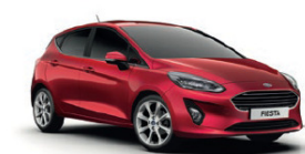
Ruby Red Metallic lakk*

Veilende utsalgspriser inkludert MVA og vrakpant. CO 2 utslipp, NO x utslipp, drivstofforbruk, miljøklasse og engangsavgift er oppgitt ut fra de seneste godkjente typegodkjenninger. Tallene og informasjonen kan variere i forhold til produksjonstidspunktet, og vi tar derfor forbehold for endringer og oppdateringer av disse. Prisene som er oppgitt i prislister, kan være endret uten at prislister er oppdatert. Vi tar også forbehold om eventuelle trykfeil. Omfanget av både drivstofforbruk og CO 2 -utslipp fremkommer av målinger som er foretatt i henhold til tekniske krav og spesifikasjoner i overensstemmelse med EU direktiv (EC) 2017/1151 sist revidert. Drivstofforbruk og CO 2 -utslipp er spesifisert for en biltype og ikke for en spesifikk bil. Testmetoden som er benyttet legger til rette for sammenligning mellom ulike bilmodeller og produsenter. Et kjøretøys drivstofforbruk og CO 2 -utslipp bestemmes ikke bare av dets energieffektivitet, men også av kjørestil og andre ikke-tekniske faktorer. CO 2 er den av drivhusgassene som bærer et hovedansvar for den globale oppvarmingen. En totaloversikt over alle nye personbilers forbruk og utslippstall er gratis tilgjengelig hos alle forhandlere og kan også lastes ned her www.vegvesen.no (Nybilveilederen). Bilens egenvekt vil kunne øke som følge av påmontert ekstrautstyr og tilbehør.