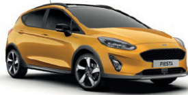
Luxe Yellow** Metallic lakk