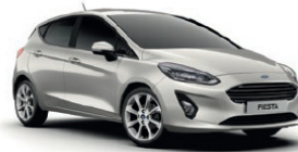
Moondust Silver Metallic lakk*