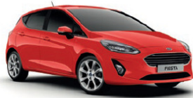
Race Red Standardlakk