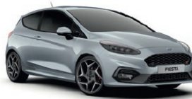
Silver Fox*** Metallic lakk