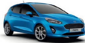
Desert Island Blue* Metallic lakk*