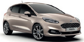
Milano Grigio† Metallic lakk**