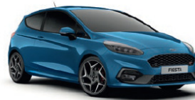
Ford Performance Blue**** Metallic lakk