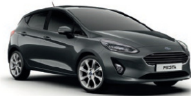
Magnetic Metallic lakk*