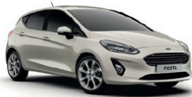
Metropolis White* Metallic lakk*