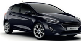
Shadow Black Mica lakk*