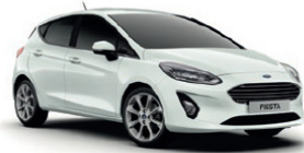
Frozen White Standardlakk*