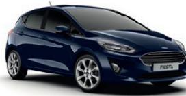
Blazer Blue Standardlakk