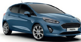
Chrome Blue Metallic lakk*