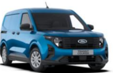
Digital Aqua Blue