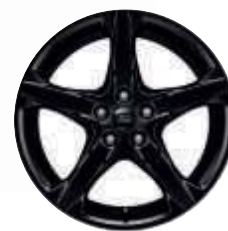
18" 5-eikers Shadow Black aluminiumsfelger

Focus ST-Line i Red & Black (Red) med 18" Shadow Black alufelger. Focus ST-Line Red & Black (Black) med 18" Shadow Black alufelger.